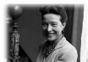
SIMONE DE BEAUVOIR und „Das andere Geschlecht“ bis 16. Oktober 2022

Vom 4. März 2022 bis 16. Oktober 2022 zeigt die Bundeskunsthalle in Bonn die Ausstellung Simone de Beauvoir und „Das andere Geschlecht.“ Simone de Beauvoir (1908-1986) gehört zu den wichtigsten Intellektuellen des 20. Jahrhunderts und gilt als Ikone der Frauenbewegung. Im Jahr 1949 veröffentlichte die Schriftstellerin und Philosophin die Studie Le deuxième sexe (Das andere Geschlecht, 1951), in der sie sich mit der Situation der Frauen in der westlichen Welt auseinandersetzte. Le deuxième sexe war ein Plädoyer für die Gleichberechtigung und ein radikaler Gegenentwurf zu dem damaligen