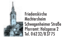
Friedenskirche Mechtersheim Schwegelheimer Straße Pfarramt: Holzgasse 2 Tel. 0 62 32/8 37 75

Anschließend Informationsveranstaltung mit Anmeldung für den nächsten Konfi-Kurs