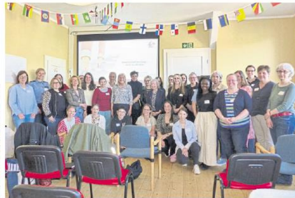
Eine große Gruppe an Frauen kam zum Netzwerktreffen in Katzenelnbogen zusammen.