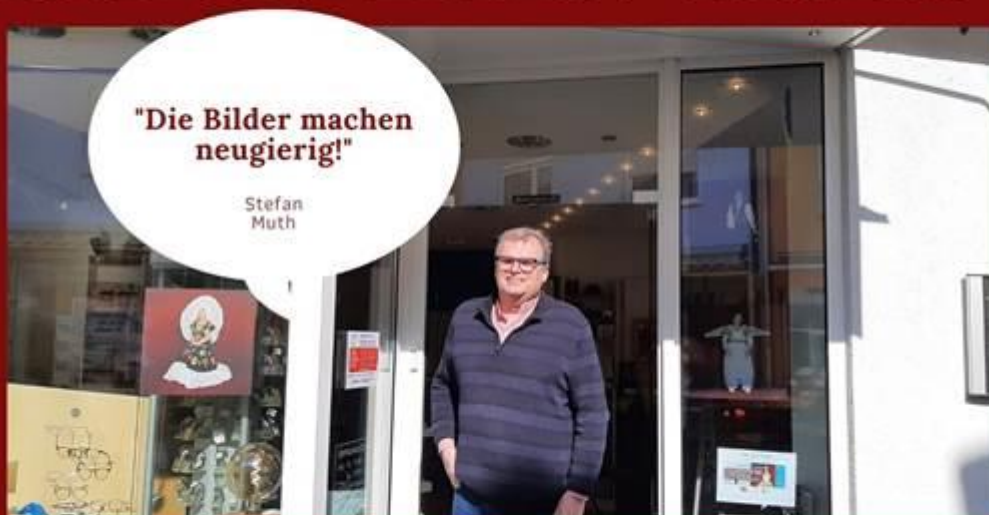
OPTIK MUTH, NASSAU