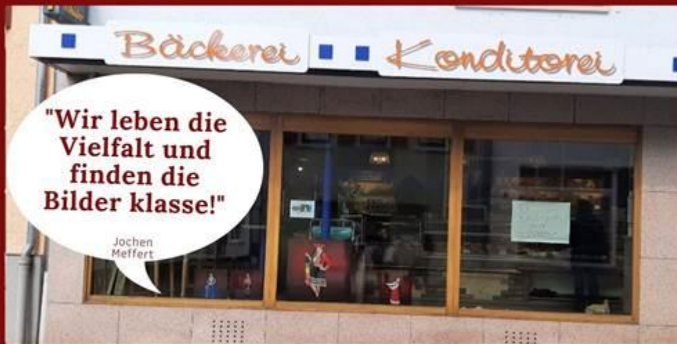
BÄCKEREI MEFFERT, NASSAU