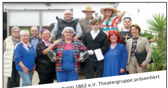
MGV Frohsinn Mecktersheim 1862 e.V. Theatergruppe präsentiert