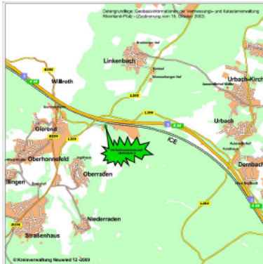
Außerschulischer Lernort - Abfallentsorgungsanlage, Deponiestr. 1, 56317 Linkenbach

Der Runde Tisch Rhein-Westerwald im Rahmen des Rheinland-Pfälzischen Interventionsprojektes gegen Gewalt in engen sozialen Beziehungen hat sich zum Ziel gesetzt, die Hilfestruktur für von Gewalt Betroffenen zu verbessern. Mit der Einrichtung der Interventionsstellen gegen Gewalt in engen sozialen Beziehungen und der engen Zusammenarbeit zwischen Polizei, Staatsanwaltschaft, Jugendämtern und Hilfeeinrichtungen wird versucht, die Gewaltspirale zu durchbrechen und Opfern die Perspektive eines gewaltfreien Lebens zu ermöglichen.