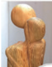
Rudolf Sichling Skulpturen

Einführung: Andreas Heck Musikalische Begleitung: Thomas Zimmeck